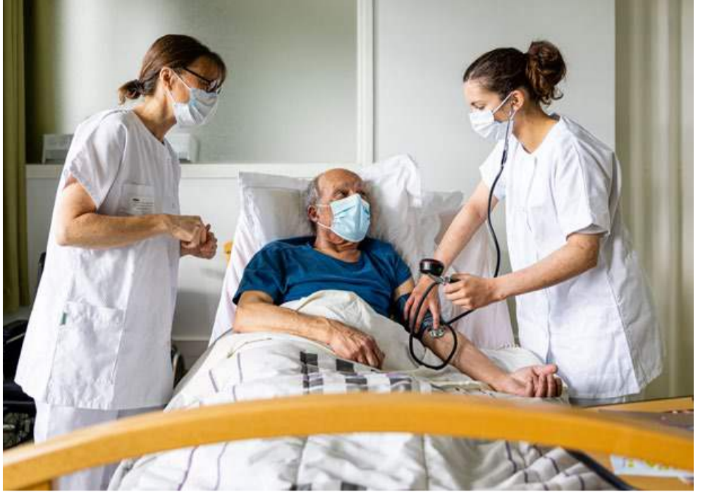
SCHÉMA RÉGIONAL DES FORMATIONS SANITAIRES ET SOCIALES 2023-2028