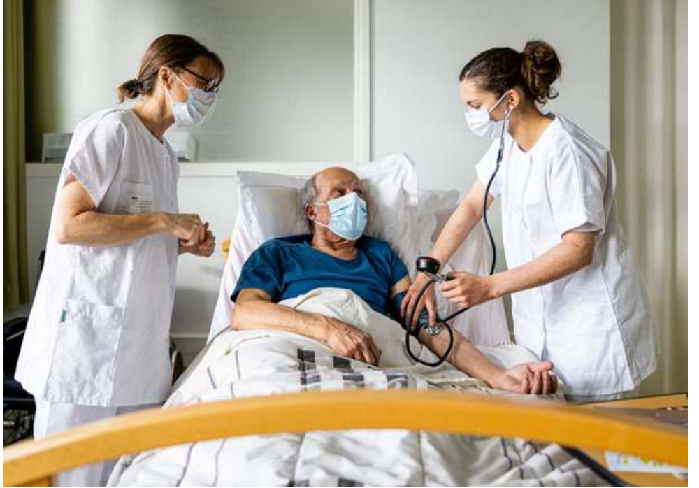
SCHÉMA RÉGIONAL DES FORMATIONS SANITAIRES ET SOCIALES 2023-2028