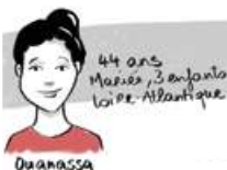
Ouanassa 44 ans Mariée, 3 enfants Loire-Atlantique

Frein principal : la sécurisation de son parcours, notamment sur le plan financier de façon à pouvoir envisager l'avenir.